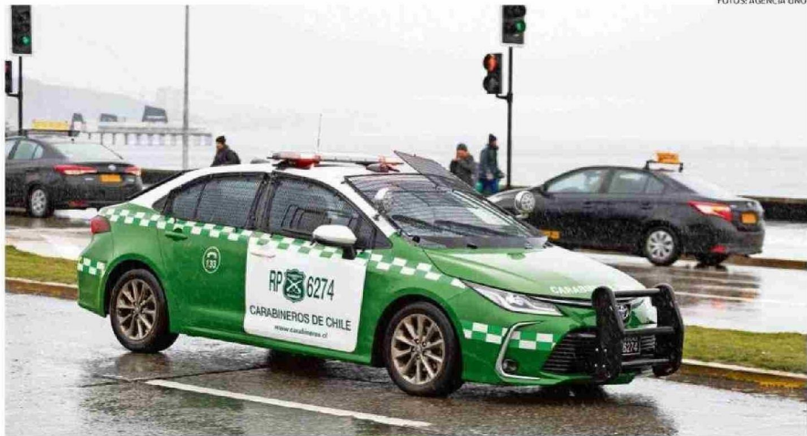
LA SEGURIDAD ES UNA DE LAS MATERIAS EXPUESTAS POR LOS PARLAMENTARIOS.