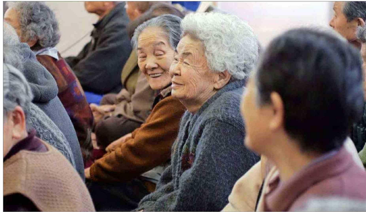
Japón es uno de los países con mayor número de centenarios en el mundo. Específicamente, la isla de Okinawa es una región identificada por Poulain y sus colegas como una Zona Azul.

"El gran problema de la sociedad actual es el estrés por su impacto negativo en la longevidad", dice el investigador. Según explica, tanto sus estudios como otros sugieren que el estrés es un mal que acorta la vida de