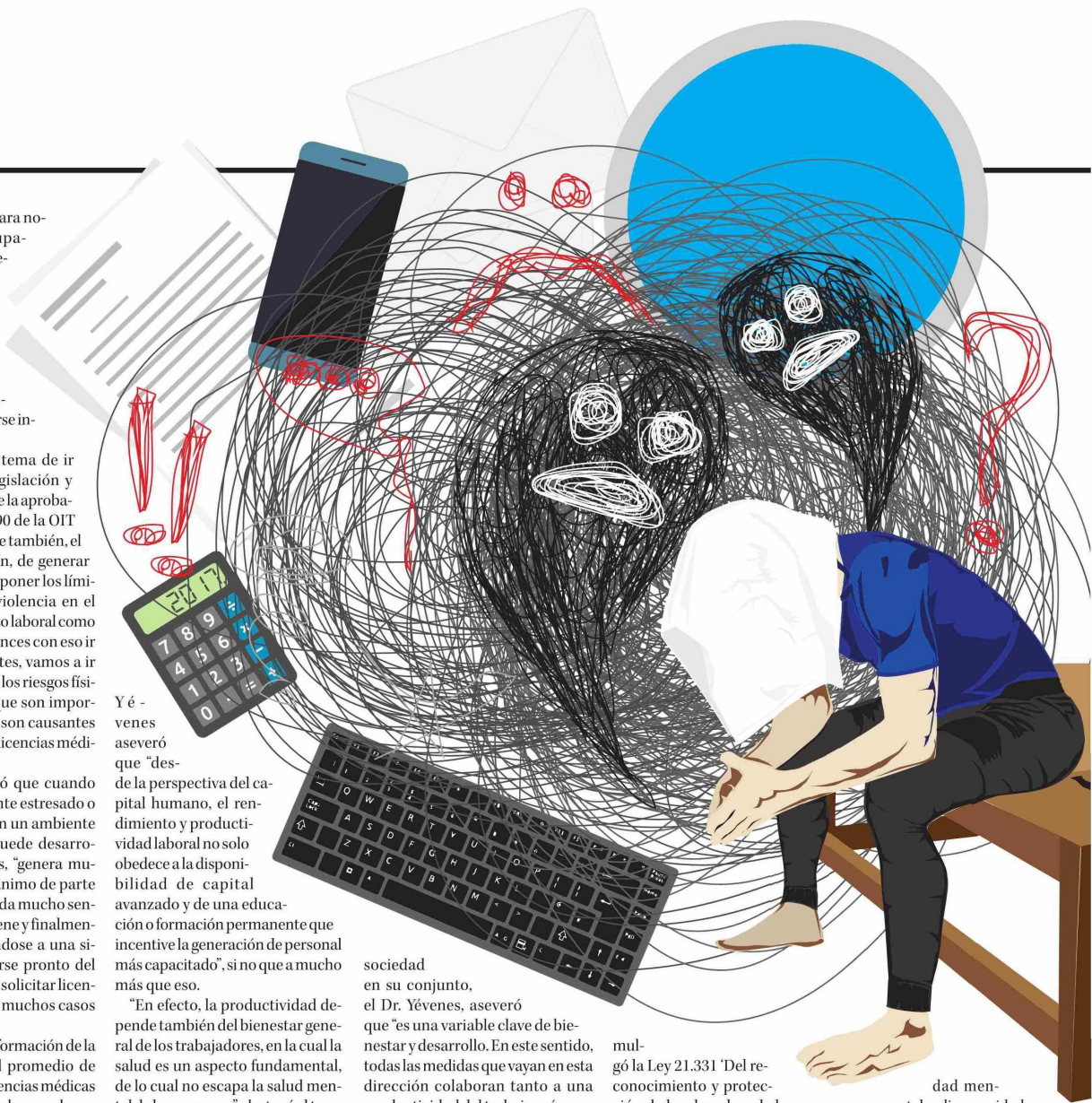
ILUSTRACION ANDRÉS ORTEGA P.

Twitter @DiarioConce contacto@diarioconcepcion.cl