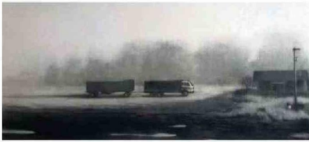
CAMIÓN, CARBÓN SOBRE TELA (2019).

Apreciamos en perspectiva la obra de una mujer comprometida con lo más genuino del ser. Su trayectoria ha estado vinculada al litoral a la fecha.