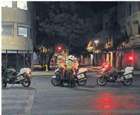
AYER SE LEVANTÓ EL TOQUE DE QUEDA PARA LAS 14 REGIONES.

de los activos de generación que no funcionaron o tuvieron fallas.