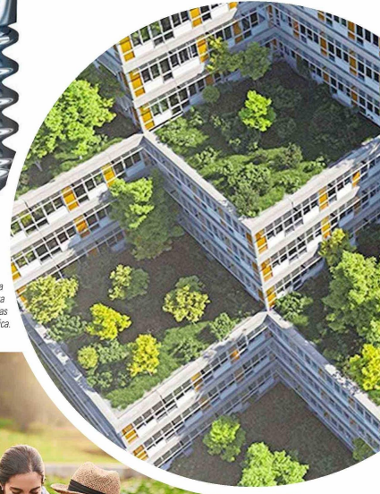
El Crédito Hipotecario Verde es parte de la campaña “Todos Somos Verdes” y entrega condiciones ventajosas para la compra de viviendas que cumplen con criterios de eficiencia energética.