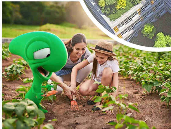
El banco presentó una nueva campaña “Todos Somos Verdes”, que entrega a sus clientes una oferta de productos “verdes”, que le permiten a Bci avanzar en el cuidado del medio ambiente.

En su objetivo por contribuir al cuidado del planeta, la entidad financiera ofrece seguros para autos eléctricos, cuyo uso ha crecido de forma exponencial.