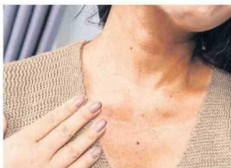
ATENCIÓN CON LAS SEÑALES QUE APARECEN EN EL CUELLO.