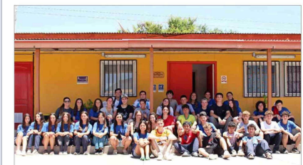
Alumnos del Colegio San Miguel Arcángel en la escuela de Guayacán, Cabildo.