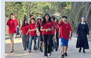
Parte del grupo de estudiantes misionando en Pomaire.