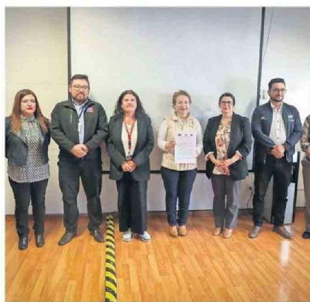
EL CONVENIO SE FIRMÓ ENTRE DPR, GOBERNACIÓN Y MUNICIPIO.

Con esto, el municipio a través de su Dirección de