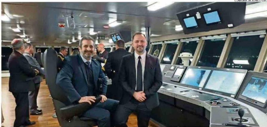
LA CONSTRUCCIÓN DEL BUQUE ROMPEHILOS REQUIRIÓ DE UNA ESTRECHA COLABORACIÓN ENTRE LOS ASTILLEROS DE LA ARMADA (ASMAR) Y LA UACH.

"Nos sentimos muy orgullosos de que nuestros exestudiantes lleven a cabo con éxito grandes desafíos, como es la construcción del Almirante Viel. Nuestros egresados, por la naturaleza de esta industria ge-