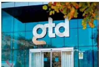
Oficinas centrales de GTD.