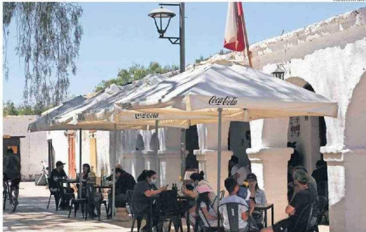
SAN PEDRO DE ATACAMA ES EL DESTINO MÁS VISITADO EN LA REGIÓN DE ANTOFAGASTA POR EXTRANJEROS.