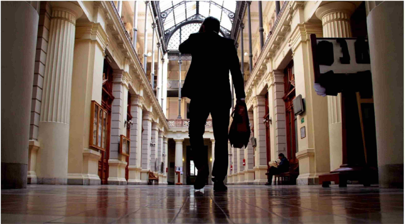
► Una de las motivaciones para elegir el ejercicio de la profesión de abogado orientada a la defensa de casos de narcotráfico es la alta renta que se percibe.