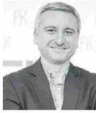
Por Jorge Fantuzzi Economista