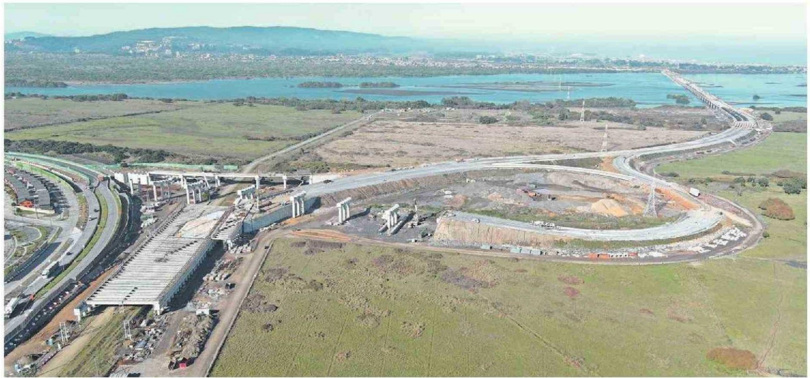
El impacto de las obras de mitigación en las viviendas aledañas a la Costanera de Hualpén es una preocupación de los vecinos.

El Puente Industrial es uno de los 24 proyectos priorizados por la mesa intersectorial que busca abordar la crisis de congestión vial en el Gran Concepción.