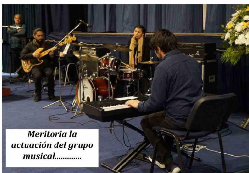
Meritoria la actuación del grupo musical.....