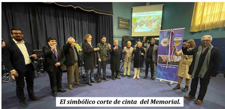
El simbólico corte de cinta del Memorial.