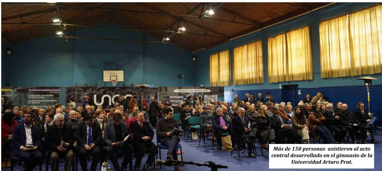
Más de 150 personas asistieron al acto central desarrollado en el gimnasio de la Universidad Arturo Prat.

Tras la finalización del acto central, que cerró con el corte simbólico de la cinta de inauguración del Paseo y con la entonación del Himno de la Escuela Normalista, los asistentes compartieron un vino de honor y luego fueron al Memorial para pasear oficialmente por él por primera vez y tomar algunas fotografías.