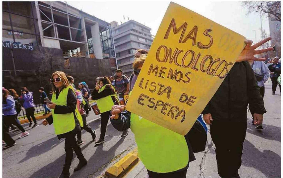
A NIVEL NACIONAL, MÁS DE 373 MIL PACIENTES ESTÁN A LA ESPERA PARA CIRUGÍAS MAYORES. COSTO SUPERA 400 MIL MILLONES DE PESOS.

En este contexto, para el parlamentario y también médico, esta realidad en lo que atañe a todo el país “no ha podido ser manejada adecuadamente desde el Minsal ni desde los servicios de salud”.