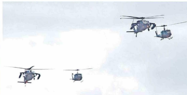
La Fach sobrevoló el parque con helicópteros Black Hawk.