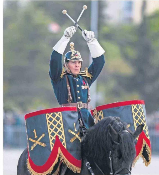
El timbalero del Regimiento Número 1 Granaderos durante el desfile.