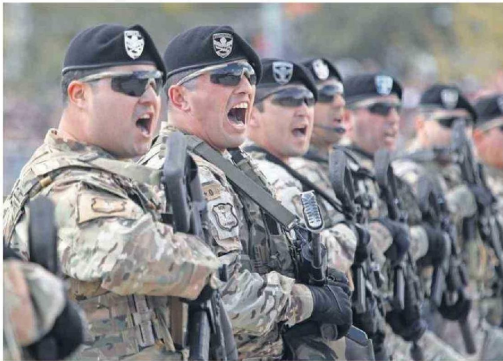
La Brigada de Operaciones Especiales entona el himno oficial del Ejército.