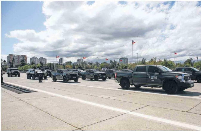
Unidades de Fuerzas Especiales de Carabineros rindieron honores a los tres mártires de Cañete.