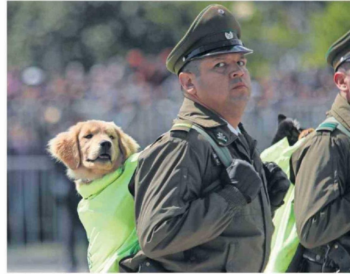
Carabineros desfiló con 16 cachorros.

La Parada Militar estuvo enfocada en presentar los recursos humanos por sobre tanques y aeronaves, aún cuando por los cielos de Santiago sobrevolaron F-16, F-5 Tigre III y aviones de transporte y helicópteros. Uno de los grandes ausentes fue la Escuadrilla de Alta Acrobacia Halcones.