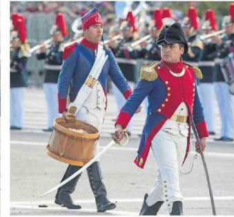
Homenaje a las influencias militares del Ejército de Chile.