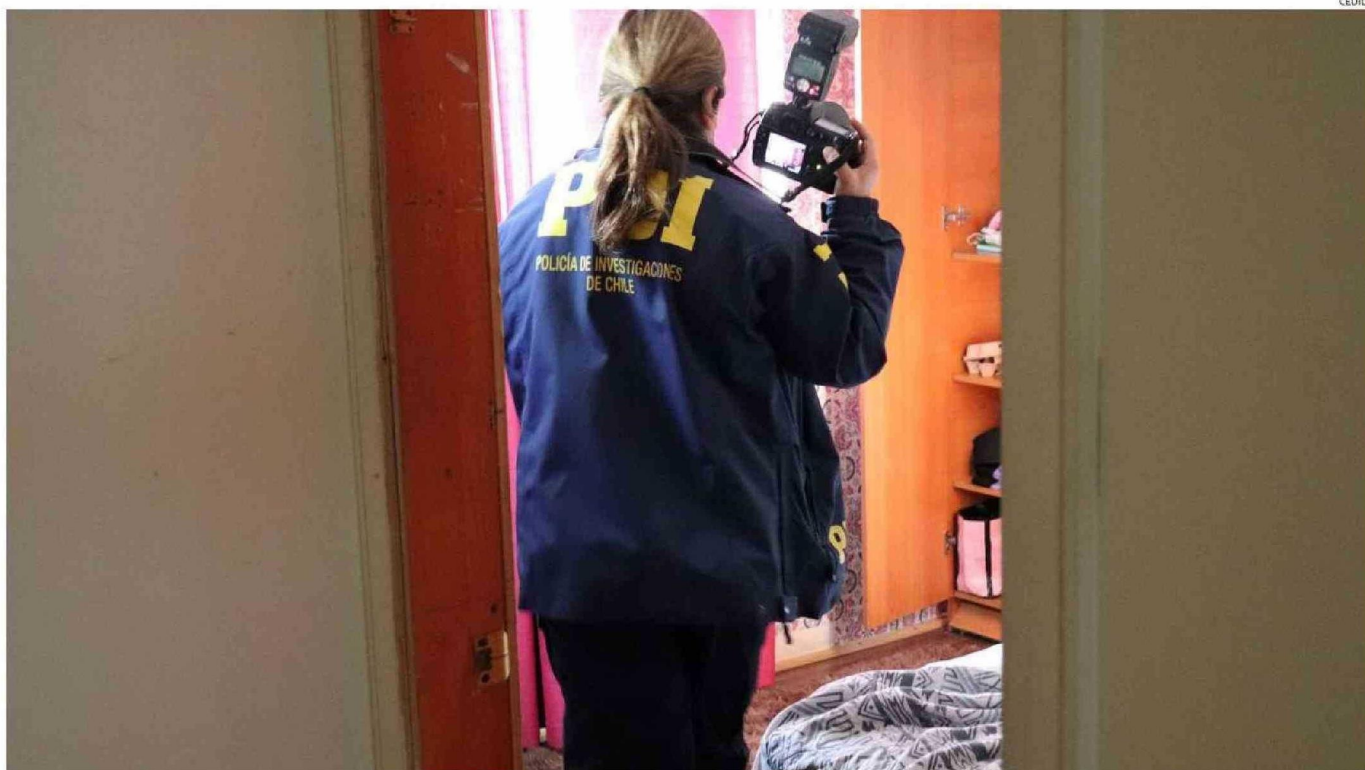
LA POLICÍA DE INVESTIGACIONES DE PUERTO MONTT DESARROLLÓ UN MINUCIOSO TRABAJO QUE PERMITIÓ REUNIR GRAN CANTIDAD DE PRUEBA QUE FINALIZÓ EN LA CONDENA DE LOS 4 EXTRANJEROS.