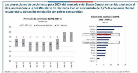
Las proyecciones de crecimiento para 2024 del mercado y del Banco Central se han ido ajustando al alza, acercándose a la del Ministerio de Hacienda. Con un crecimiento de 2,7% la economía chilena recuperará su ubicación en relación con países comparables

"Es cierto que la política fiscal se guía a partir de la regla del balance cíclicamente ajustado, el