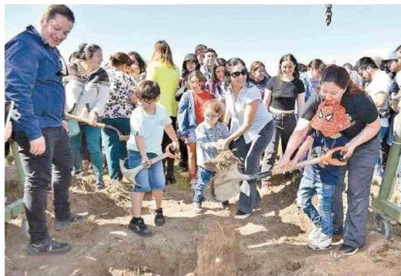
Futuras propietarias y menores participaron con mucha alegría del acto simbólico que marca el inicio de la construcción de las viviendas.

tórico a destacar en el gobierno del Presidente Gabriel Boric, ya que uno de los temas a los cuales ha puesto énfasis, efectivamente es el Plan de Emergencia Habitacional el cual cumplimos en noviembre con la inauguración de los lotes de Costaneras y a lo cual contribuye también la entrega del plan de Esperanza