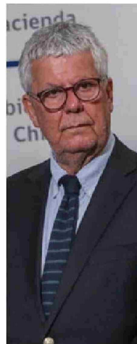
Nicolás Eyzaguirre, exministro de Hacienda.