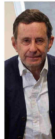
José De Gregorio, expresidente del B. Central.

en 2017, recibió $661,23 millones en 2023, por encima de los $642,5 millones de 2022.