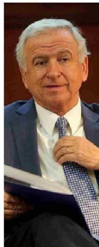
Felipe Larraín, exministro de Hacienda.