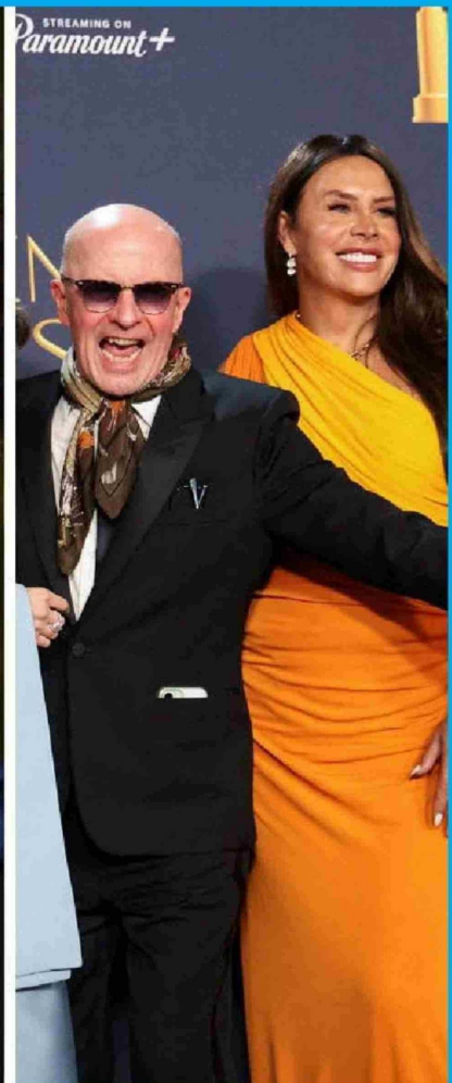
► Los actores Demi Moore, Timothée Chalamet, y el director Jacques Audiard junto a la actriz Karla Sofia Gascón.