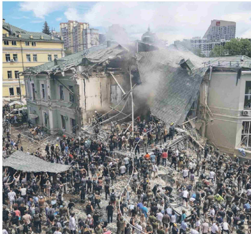
► Rescatistas trabajan en el Hospital Infantil Ohmatdyt tras un ataque con misiles rusos, en Kiev.