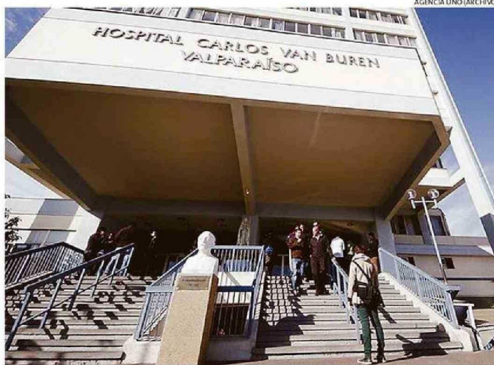
PESE A QUE SE DIJO QUE LOS 4 PABELLONES CERRADOS PREVIAMENTE SE ABRIRÍAN, NO HA OCURRIDO.

Quien sí abordó esta preocupante problemática que impactará directamente en la resolución de la lista de espera quirúrgica, fue Sagredo.