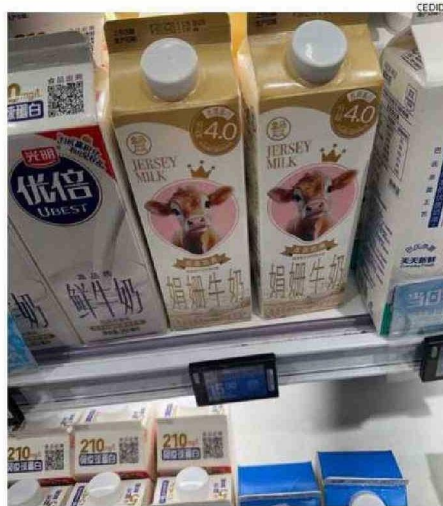
LECHES DE TODOS TIPOS SE VEN EN LAS GÓNDOLAS CHINAS.

que China retomará la senda del crecimiento económico, por lo tanto, el consumo de leche va a aumentar y así la leche nacional tiene una gran oportunidad de cubrir esa demanda.