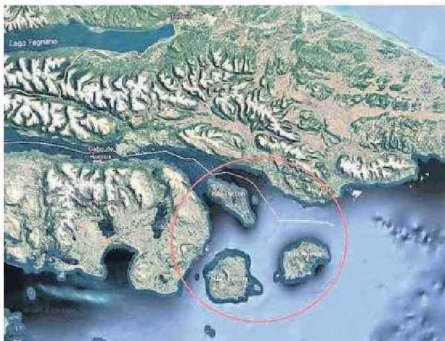
LAS ISLAS EN EL EXTREMO SUR POR LAS QUE SE INICIÓ LA DISPUTA.

más antiguo y de gran experiencia estaba preparado para vivir esa difícil situación. En lo militar y como buen chileno, asumí que era nuestro deber y que la patria nos necesitaba”, manifestó.