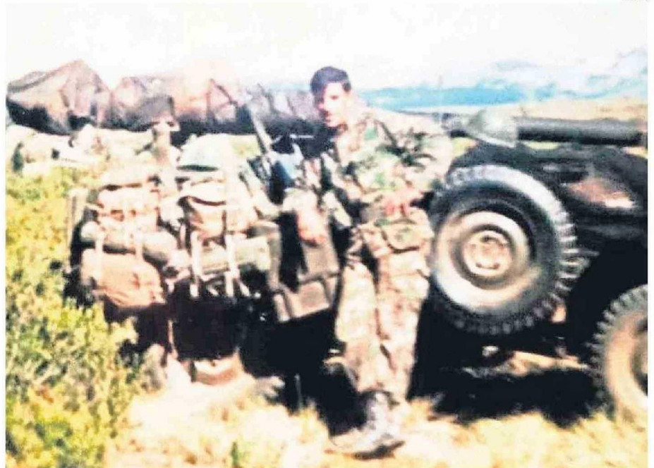
SOLDADOS DEL REGIMIENTO CHACABUCO SE APOSTARON EN LA ZONA FRONTERIZA CON ARGENTINA HACE 46 AÑOS.

“Recuerdo aquella tarde del 22 de diciembre como si fuera ayer, cuando nos dijeron que teníamos que arrancar y preparar nuestro equipo para irnos a las posiciones de combate en Primera Angostura. De inmediato pensé que podría tratarse de mi última comida caliente; por lo