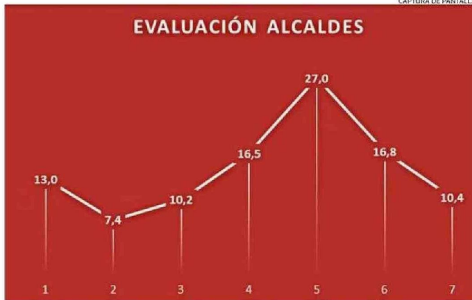
LA GESTIÓN DE LOS ALCALDES Y ALCALDESAS ES BIEN EVALUADA EN LA REGIÓN DE LOS RÍOS.

cumple su primer periodo democráticamente electos", complementó.