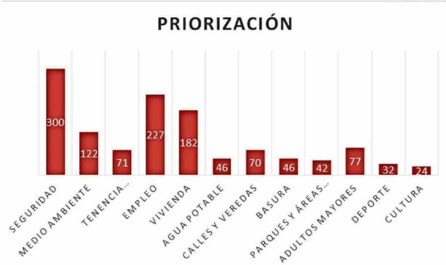
ENCUESTADOS MENCIONARON LOS TEMAS QUE DEBERÍAN SER PRIORITARIOS PARA LAS AUTORIDADES.

de los encuestados corresponde a la comuna de Valdivia. Del total de entrevistados, el 62,8 por ciento fue mujeres, según informaron.