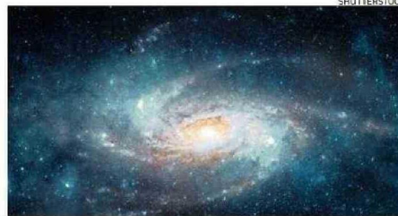
SE PODRÁN VER GALAXIAS QUE ESTÁN HASTA A 10 MILLONES DE AÑOS LUZ.

"Los gobiernos deben reducir las desigualdades de riesgo haciendo que los estilos de vida saludables sean lo más asequibles posible para todos".