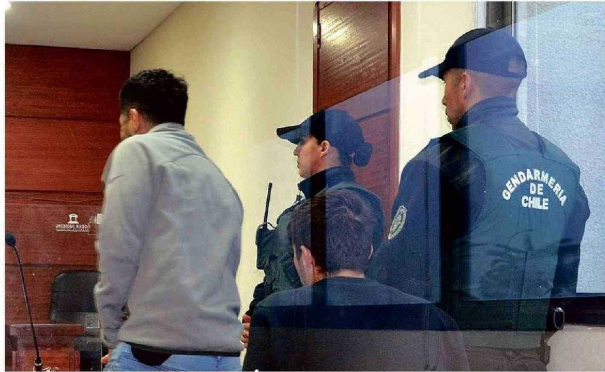
LOS DETENIDOS POR CARABINEROS FUERON FORMALIZADOS AYER. UNO QUEDÓ EN PRISIÓN PREVENTIVA.

Al entrevistar a las trabajadoras de la farmacia y a los guardias del "súper" carabineros se dieron cuenta de inmediato que se trataba