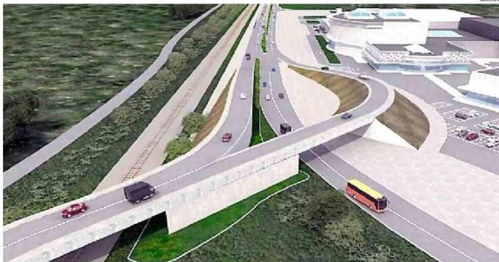
EL PROYECTO CONSIDERA UNA VÍA ELEVADA SOBRE LA RUTA V505 O AVENIDA FERROCARRIL, LO QUE PROMETÍA ACORTAR LOS DESPLAZAMIENTOS. (viene de la página anterior)

337 metros es el tramo que se proyecta podría intervenir el paso sobre nivel, donde se mantendrían la doble vía, en ambos sentidos del tránsito.