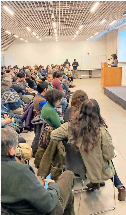
La visita generó mucho interés en la región.

Diversos fueron los intercambios y los conocimientos que pudieron compartirse en esta instancia de encuentro entre instituciones canadienses y comunidades Mapuches de la región de La Araucanía.