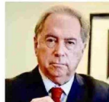
JUAN GABRIEL VALDÉS (77):

Político, jurista y diplomático, es el actual ministro de Relaciones Exteriores. Nacido en Amsterdam, llegó a Chile a los dos años. En su carrera ha sido subsecretario de Relaciones Exteriores, agente del Estado de Chile ante la Corte Internacional de Justicia en la demanda de Perú y embajador en Bélgica, Luxemburgo y la Unión Europea. Su destacada trayectoria combina el servicio público con una sólida carrera académica, siendo Profesor Titular del Instituto de Estudios Internacionales y de la Facultad de Derecho de la Universidad de Chile.