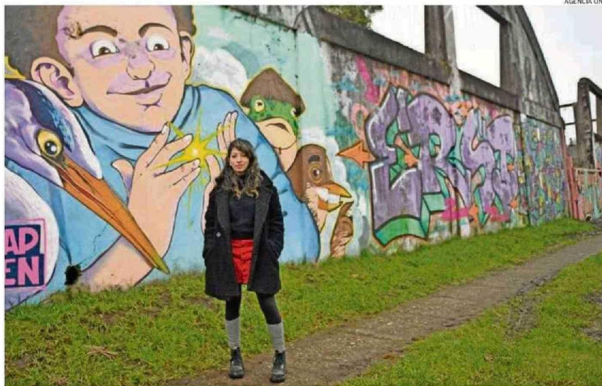
AL PARQUE CULTURAL LE FALTA CONEXIÓN CON LA MATRIZ DE AGUA POTABLE, POR ELLO SE HABILITÓ UNA CAMPAÑA PARA COSTEAR LA INVERSIÓN.

- Siempre tiene que haber un diálogo entre el Estado y la comunidad. No creo en la mirada paternalista del Estado, ni que además tenga que tomar las riendas de todo. Pero sí tiene gran responsabilidad considerando que básicamente tiene la técnica y el dinero para hacer cosas como las que finalmente han debido asumir las comunidades. Tal vez la comparación sea un poco desproporcionada, pero a diferencia de Chile, en Europa todo es patrimonio. Acá por el contra-