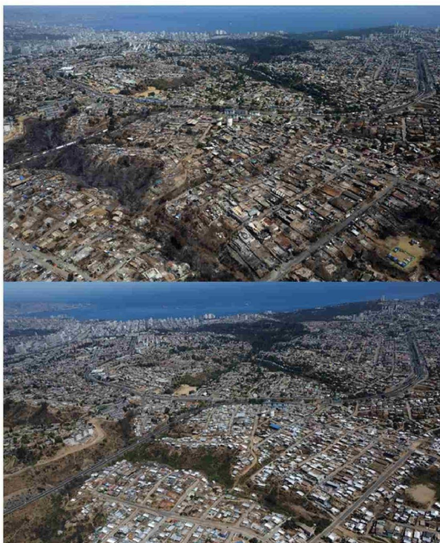
(Imagen comparativa a un año de la tragedia, Villa Independencia)

A eso de las 11 de la mañana se llamó a evacuar el sector de El Salto, en Viña del Mar, se volvió a activar el foco de Peñuelas y también