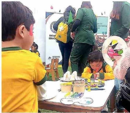
LO MEJOR ES IR A ACTIVIDADES AL AIRE LIBRE.

Una de las primeras recomendaciones que entregó a los padres es privilegiar actividades en espacios al aire libre, como plazas o parques. “Pero sabemos que eso no es posible siempre, por lo cual tene-