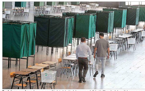
Desde tempranas horas de ayer se procedió a la instalación de las mesas en la Estación Mapocho de la capital, que nuevamente será sede electoral. Lo mismo ocurrirá en otros locales de votación.

En dos gobernaciones del país, Los Lagos y Antofagasta, se enfrentarán dos candidatos de un mismo sector.