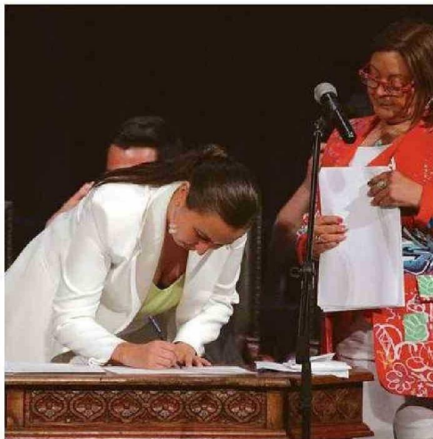
LA TAMBIÉN ABOGADA ASUMIÓ EL CARGO EL 6 DE DICIEMBRE.

manas a las personas del eje del Congreso.