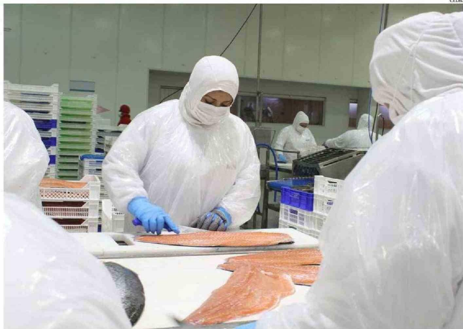
TANTO EN EL CONSEJO DEL SALMÓN, COMO EN SALMONCHILE, RECLAMARON POR EL ESTANCAMIENTO Y CERTEZAS PARA RETOMAR EL CRECIMIENTO.

Admitió que “esta desaceleración nos preocupa”, ya que aunque el salmón sigue siendo el segundo producto más exportado, “no estamos crecien-