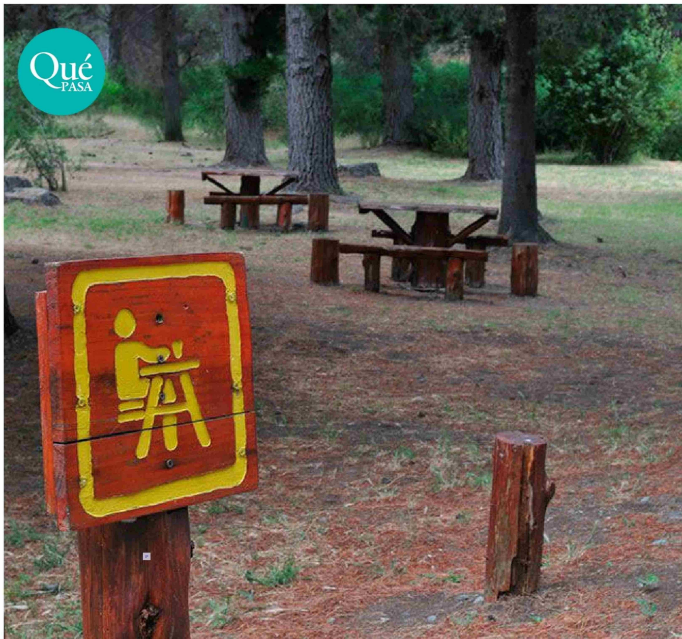
► Durante el verano, debido a las altas temperaturas y la temporada de vacaciones, se producen desplazamientos de personas a zonas donde habita el roedor.