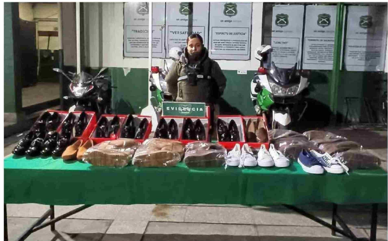
LOS ZAPATOS RECUPERADOS por la SIP fueron avaluados en 650 mil pesos.

Ello, tras ser sorprendido con más de 20 envases de shampoo que habían sido sustraídos desde una farmacia Cruz Verde, ubicada en calle Colón, al llegar a Rengo.