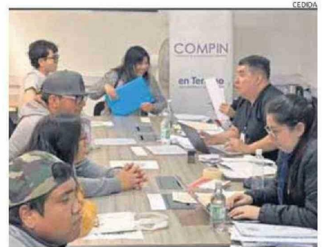
ALUMNOS DE LA F-33 EL CON PERSONAL DE LA COMPIN.