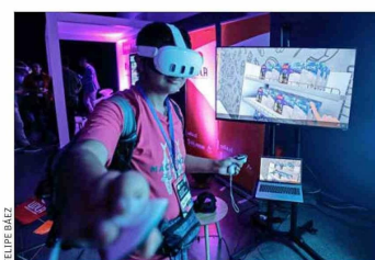
La UDLA exhibió una aplicación de realidad virtual que ayuda a personas de la tercera edad con deterioro cognitivo. Todos los asistentes la pueden probar.