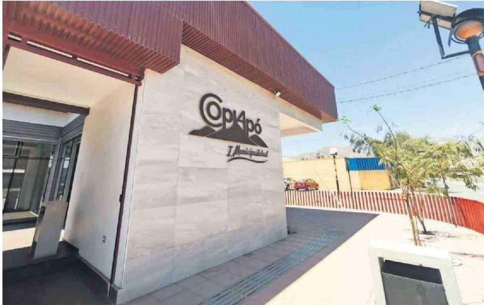
PAIPOTE CUENTA CON UN CENTRO DE SERVICIOS DE LA MUNICIPALIDAD.

“El Centro Urbano es un inmueble municipal que se pone al servicio de la comunidad paipotina, razón por la cual se instaló allí un bancomático”