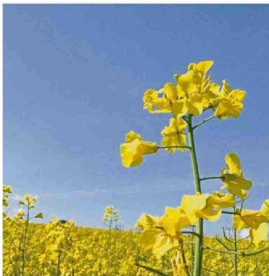
El raps canola es uno de los cultivos destinado a la alimentación de los peces.