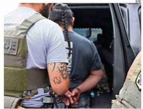
LA MEDIDA APUNTA A ENFRENTAR CON MÁS FUERZA A ESTOS GRUPOS.