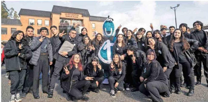
A la capital penquista llegaron jóvenes de toda la región, junto a directores y profesores con experiencia en educación musical.

Tiraje: 10.000 Lectoría: 30.000 Favorabilidad: No Definida