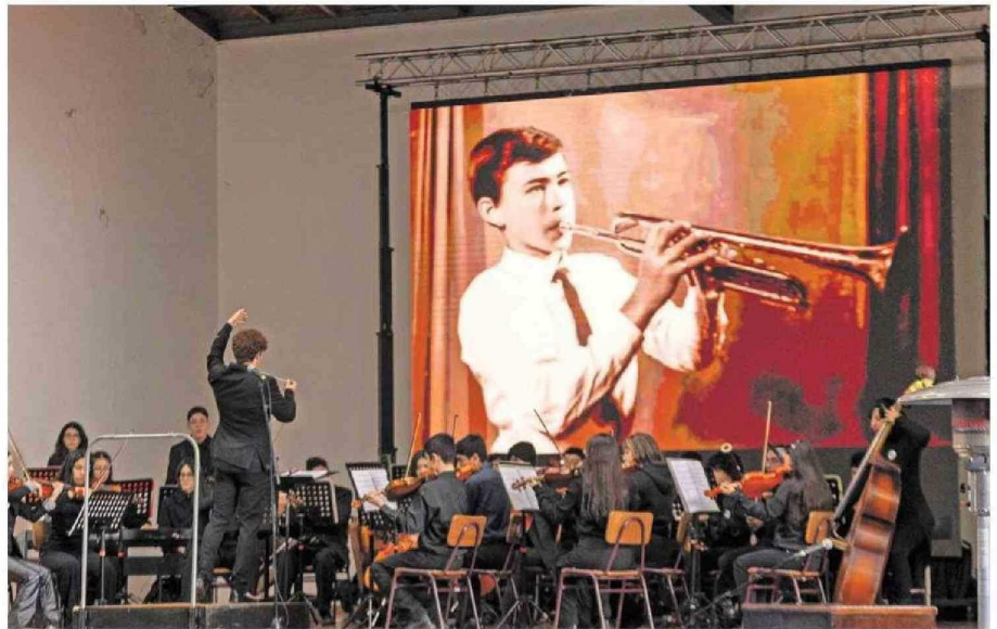
Desde La Serena, la Orquesta Filarmónica Intermedia dio el vamos al encuentro que se extenderá hasta el domingo con variadas actividades.

El encuentro vivirá su cierre con un gran concierto el domingo en Teatro Biobío, a las 19 horas, con entradas ya agotadas, junto a directores invitados.