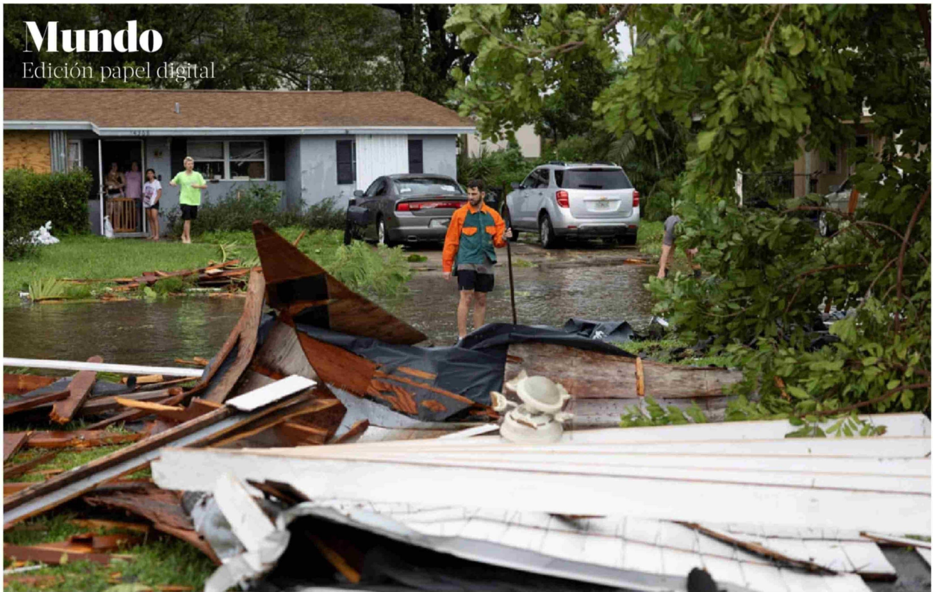
► Las primeras ráfagas de Milton ya causaron daños importantes, fundamentalmente en las zonas directamente costeras.