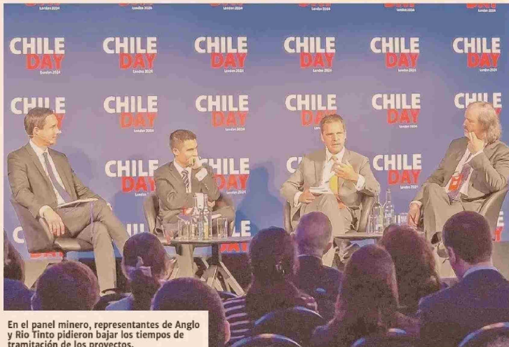
En el panel minero, representantes de Anglo y Río Tinto pidieron bajar los tiempos de tramitación de los proyectos.