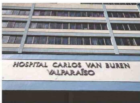
DESDE EL HOSPITAL PORTEÑO NO EXISTIÓ RESPUESTA AL CASO.

Sin perjuicio de ello, “al no recibir tan buena